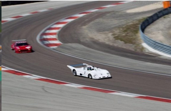
Lola T298 BMW