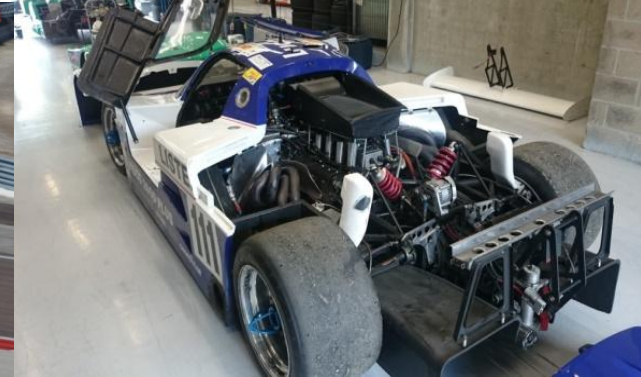
Spice SE 88 FORD