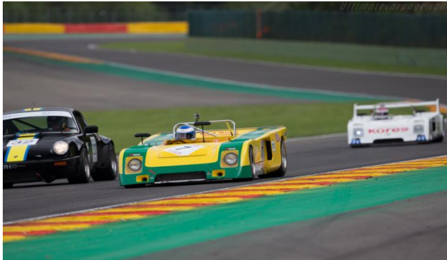
Chevron B21 BDG