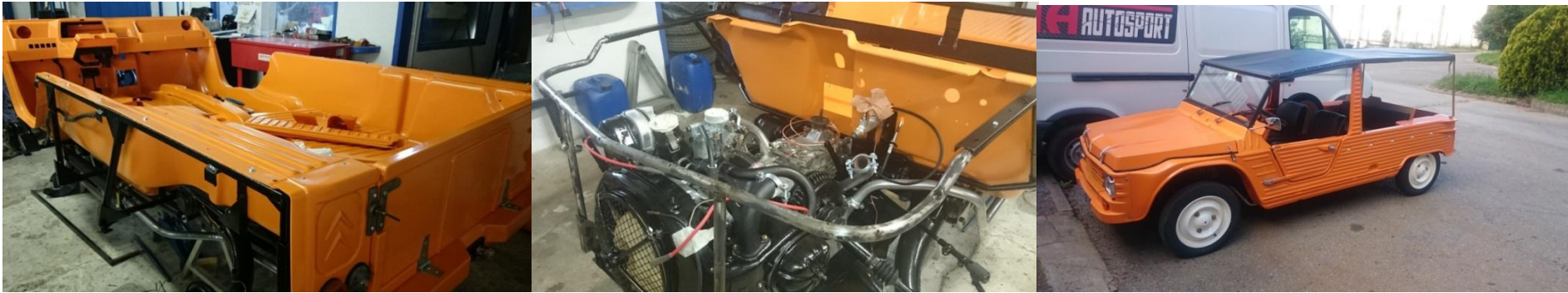
Citroën Méhari (1977)