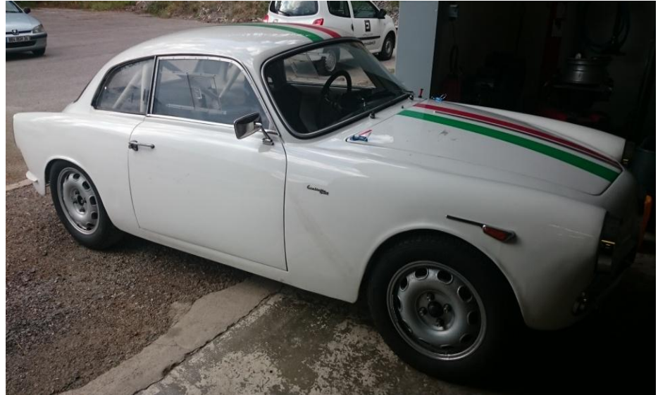
Alfa Roméo Giulietta Sprint