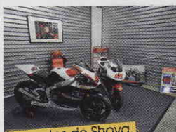
Les motos de Shoya, sa 250 cm 3 en arrière plan et sa Moto2, étaient exposées dans les stands.

Si une émotion certaine planait au-dessus de cette journée, l'ambiance était aussi bon enfant.