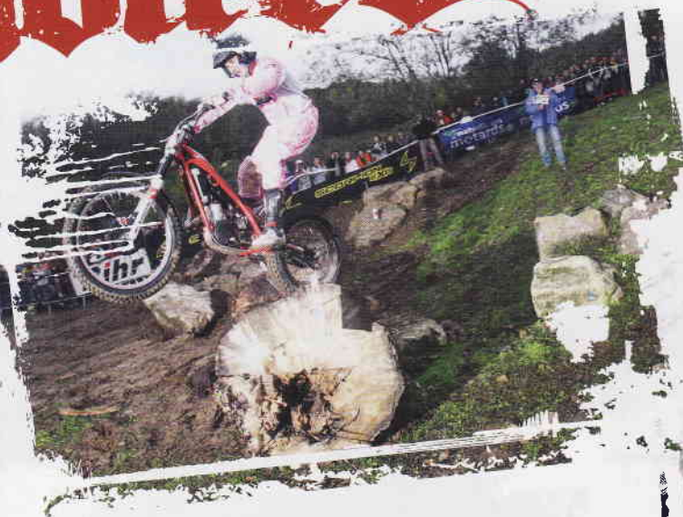
C'est haut les roues que Nuques le Fol, tout de rose appareillé, conquiert un Graal que même Dame Ludivine, experte en rotation du poignet, espérait caresser.