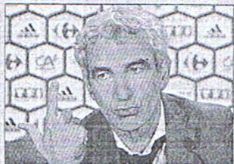
DEUXIÈME CAHIER P. 8