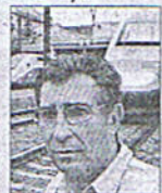
DEUXIÈME CAHIER P. 2

La vigilance sans faille de l'aiguilleur héraultais